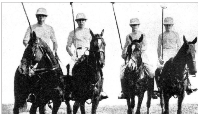
Équipe d'Argentine, médailles d'or : J.B. Miles, E. Padilla, J.D. Nelson, Capitaine A.J. Kenny.

La devise olympique : "Citius, Altius, Fortius" est utilisée pour la 1 ère fois aux Jeux de 1924 à Paris de même que le lever de 3 drapeaux à la cérémonie de clôture (celui du Comité International Olympique, celui du pays hôte et celui du prochain pays à accueillir les Jeux).