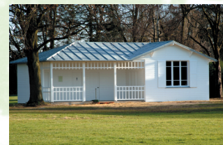
Le club-house du polo reconstruit.

Le club-house du polo reste le seul vestige de cette époque. Il a été reconstruit à l'identique (sur une dalle en béton), afin de garder la mémoire de cette partie de l'histoire du Golf de Saint-Cloud.